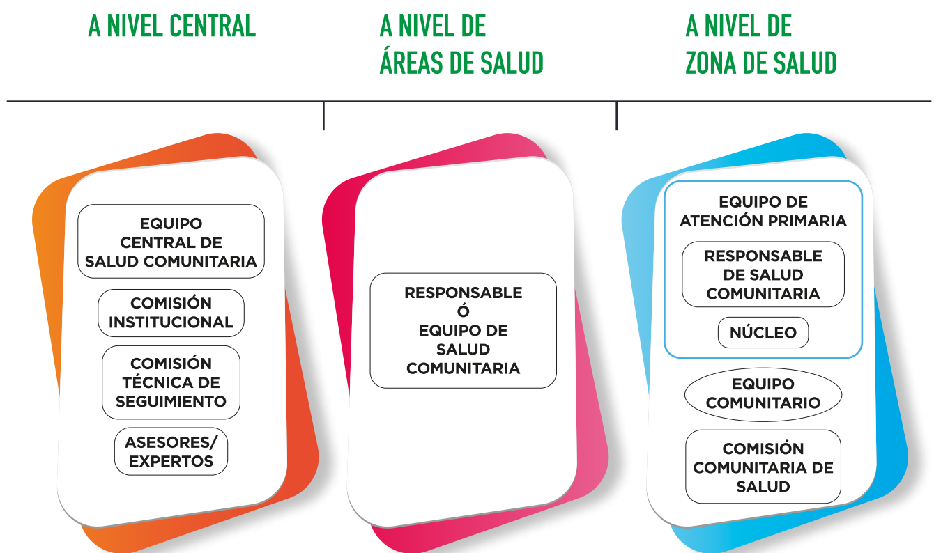
Figura 1. Estructura organizativa por niveles para la implementación de la Estrategia.

Esta estructura se establece siguiendo el modelo organizativo del Servicio Extremeño de Salud, a nivel central, de Área y de Zona de Salud.