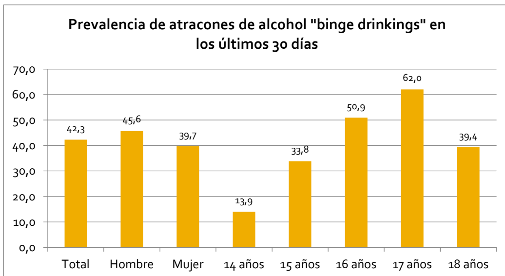
Tabla 3.2.8 Frecuencia en la toma de 5 o más vasos de alcohol en una misma ocasión los últimos 30 días por sexo y edad