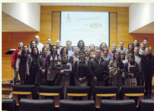
Farmacéuticos de Badajoz y Llerena-Zafra en el Hospital Infanta Cristina durante el desarrollo del Módulo I.