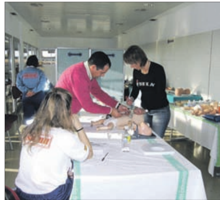
Curso de soporte vital avanzado neonatal en 'Tierra de Barros'.

Otro de los cursos contemplados dentro del calendario Interreg, es el celebrado en el Centro Coordinador 112, en Mérida, para entrenar en habilidades de comunicación. Y en el área placentina se han organizado hasta cuatro actividades formativas, 5 para los profesionales de los centros de salud, y uno específico para los de las UMEs.