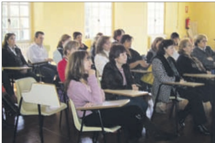
Las matronas en el curso-taller sobre seguridad del paciente.

Este programa formativo pivotó en torno a dos bloques, uno general y otro específico. El primero contempló formación a