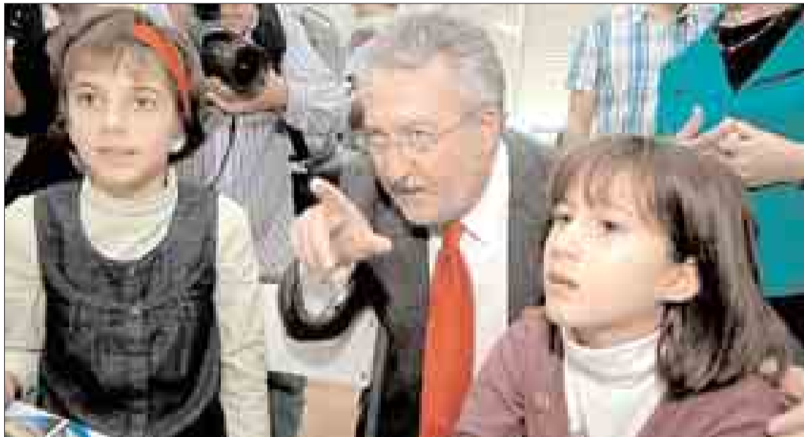
El ministro Soria con alumnas del colegio ‘Francisco Pizarro’ de Cáceres, donde presentó el programa.

El ministro de Sanidad, Bernat Soria, elige Extremadura para presentar la segunda edición de este programa del Plan Nacional de Drogas