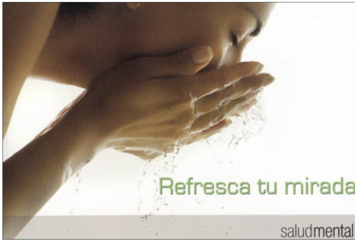
Cartel de la Campaña 'Refresca tu mirada'.

'Refresca tu mirada' es el lema de una campaña informativa llevada a cabo entre la población con el fin de acabar con los prejuicios que la rodean