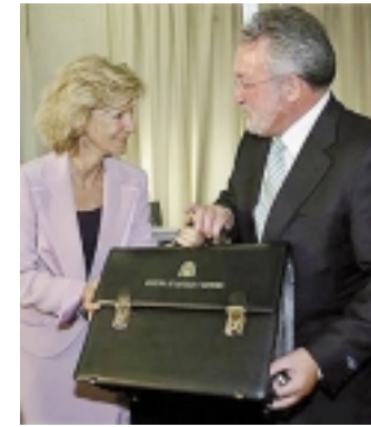
Salgado pasa el testigo a Soria.

Bernat Soria, nuevo ministro de Sanidad y Consumo