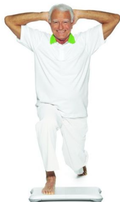
Tabla de equilibrio: ejercicio físico para prevenir caídas

Plantillas inteligentes: evaluación del riesgo de caídas