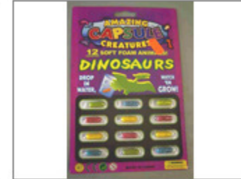
CÁPSULAS DE COLORES QUE AL INTRODUCIRLAS EN AGUA SE CONVIERTEN EN DINOSAURIOS "AMAZING CAPSULE CREAT..." 107/2016