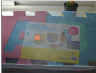
TAPIZ FOAM DE 28 PIEZAS, MARCA TOY PLANET, MODELO TPKINOKB001