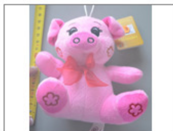
CERDITO DE PELUCHE ROSA, MARCA EASETIME TOYS, ÍTEM Nº ET-5820 108/2016