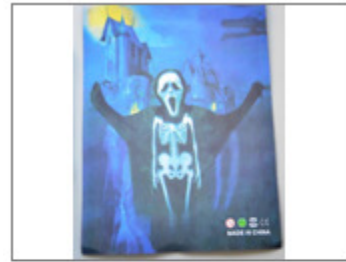
DISFRAZ INFANTIL DE MUERTE "HALLOWEEN COSTUME", MARCA YS, REF. 6555 145/2016