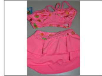
BIQUINI PARA NIÑA, MARCA AMORARMA, MODELO STYLE: 1528, TALLA 2-4 AÑOS 403/2016