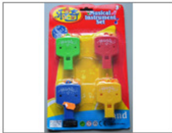
SET DE SILBATOS, MARCA LEQI, REF. 6279747#B, N° DE LOTE: 01-2014 169/2016