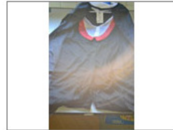
DISFRAZ DE VAMPIRO, MARCA ATOSA, TALLA 3-4 AÑOS, REF. PA19/3-4, LOT