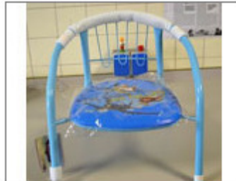
SILLA DE PLÁSTICO Y METAL PARA NIÑOS, MARCA DIAKAKIS, REF.