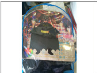
DISFRAZ DE "BATHEROE", MARCA PARTILANDIA 2010, REF. 15193 109/2016