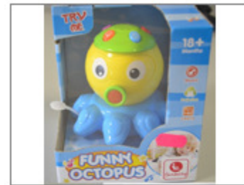
PULPO DE JUGUETE CON MECANISMO DE LUZ Y SONIDO, MARCA FANTASTIKO, REF 84119, LOTE 03/2015 373/2016