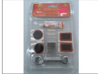
KIT DE REPARACIÓN DE BICICLETAS "BIKE REPAIR KIT" CON PEGAMENTO "RED SUN", MARCA FEIYUE TOOL, REF. 1... 131/2016