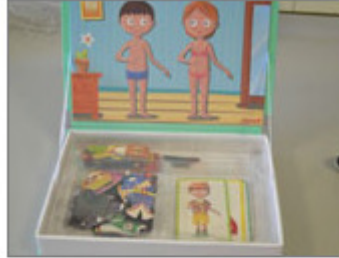
LIBRO MAGNÉTICO "MAGNETIC BOOK", MARCA JANOD, REF. 05539, LOTE 3084/3084/J05539 290/2016