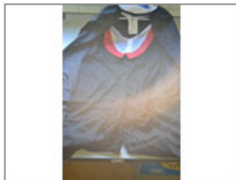
DISFRAZ DE VAMPIRO, MARCA ATOSA, TALLA 3-4 AÑOS, REF. PA19/3-4, LOT