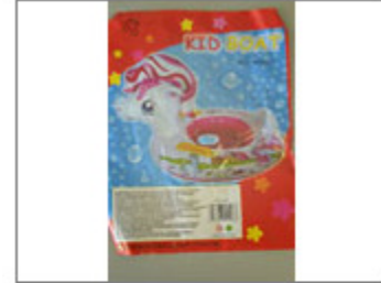
FLOTADOR DE ASIENTO CON CABEZA DE PONY, MARCA KID BOAT, REF. SY-A1197 262/2016