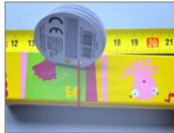
ARMÓNICA DE JUGUETE, MARCA ITSIMAGICAL, MODELO 71211, REF. #SAWT092 167/2016