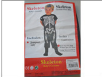
DISFRAZ INFANTIL DE ESQUELETO "SKELETON", MARCA BABY'S COSTUME, MODELO Nº 88206 (TALLA 3-4 AÑOS) 139/2016