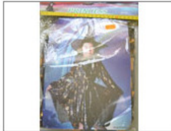
DISFRAZ DE BRUJA, MARCA PRINCESS, MODELO ITEM NO: 2144-100 418/2016