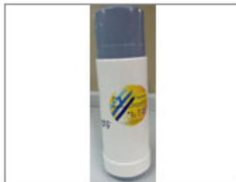
TERMO MARCA MAXIM, REF 63831.- T.L. 3/4