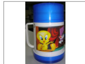
THERMOLYMPIC MARCA WARNER, MODELO TS WARNER 1/2 STANDAR 6,