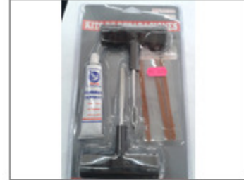
KIT DE REPARACIONES DE BICICLETAS, MARCA RAX, REF. 601224 130/2016