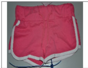
CALZÓN INFANTIL PARA NIÑA, MARCA OFT, REF 550252-550254 402/2016