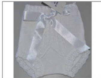
BRAGA TRENZA MARCA JULIANA, MODELO 561-B 394/2016