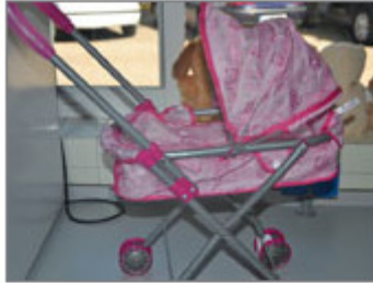
SILLA DE PASEO CON CAPAZO PLEGABLE PARA MUÑECAS "BABY CARRIAGE", MARCA OUSDY, ÍTEM N0:TL6814. 424/2016