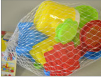
CONJUNTO DE JUEGOS DE PLAYA EN RED, MARCA SAND TOY, MODELO ITEM NO. P09/39-0909 293/2016