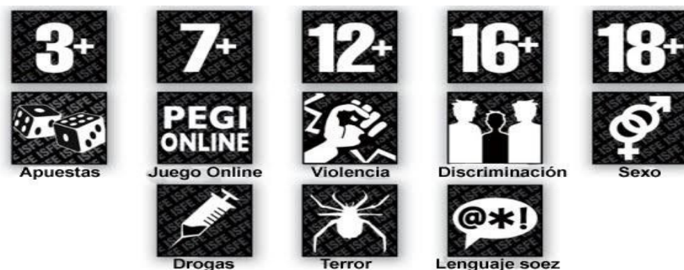
Figura nº1.- Pictogramas no obligatorios que pueden aparecer en el envase de un videojuego