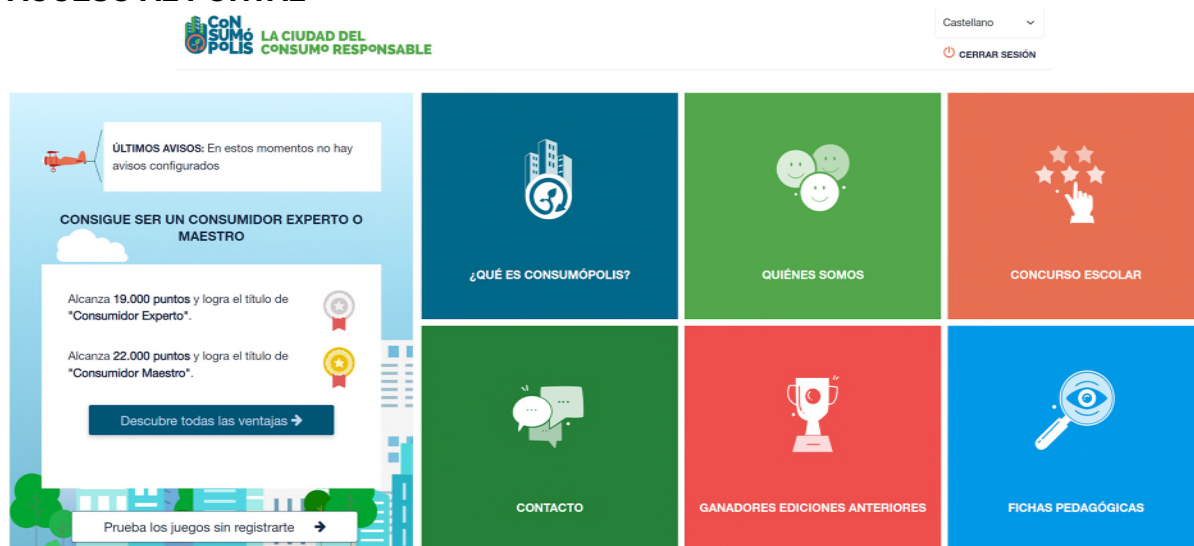
Imagen nº1: pantalla del portal principal de Consumópolis