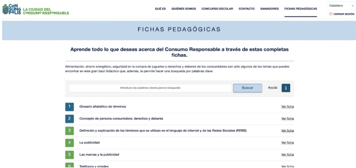
Imagen nº2: pantalla del interfaz de acceso a las fichas pedagógicas

Permite acceder a las fichas pedagógicas que sirven de apoyo a las personas participantes para responder a las preguntas del concurso. Se pueden consultar on-line y también descargar e imprimir.