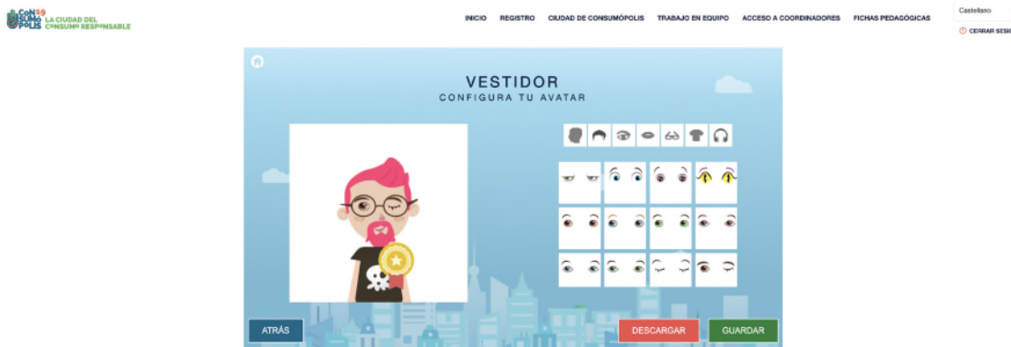
Imagen nº8: pantalla del vestidor (personaje virtual del alumnado)

Cada uno de los miembros del equipo debe configurar un personaje virtual para lo que dispone de un vestidor, al que puede acceder una vez que se haya identificado. Este personaje le representa durante todas las pruebas por la ciudad virtual y también figura en la clasificación final, junto a su nombre de usuario y a los de los otros componentes del equipo. Para preservar su anonimato, las personas participantes aparecen en todo momento en el sitio web con su nombre de usuario.