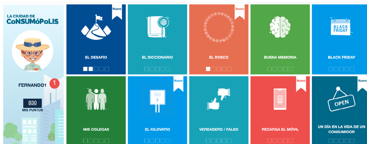
Imagen nº6: pantalla de acceso a las 10 pruebas (parte 1) y al vestidor

Permite acceder a las diez pruebas planteadas en el concurso por la ciudad virtual de Consumópolis. Para poder acceder es necesario registrarse previamente. Las nuevas pruebas EL DESAFÍO, EL ROSCO y UN DÍA EN LA VIDA DE UN CONSUMIDOR abrirán su acceso a partir del 07/11/2024