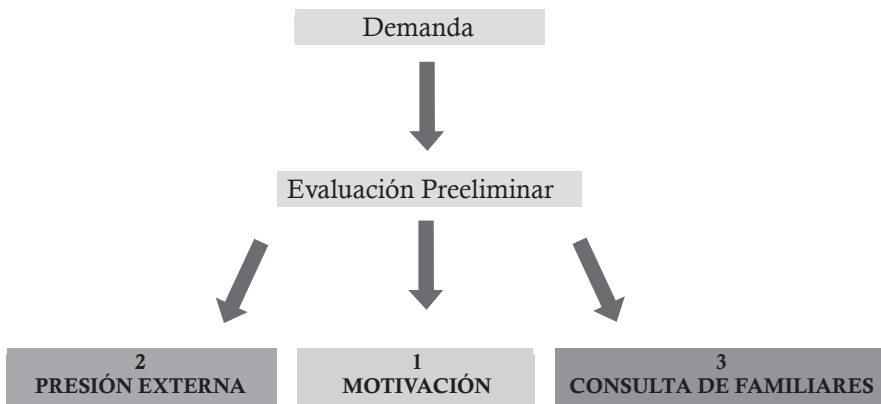
Diagrama de decisión nº 1